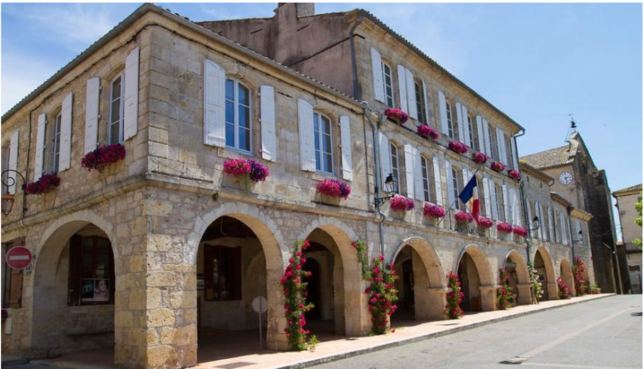
Mairie de Montréal du Gers