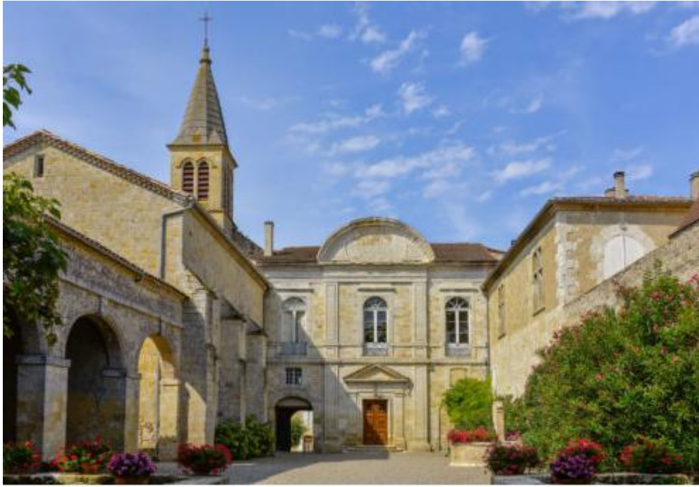
Château de cassaigne < vin, spiritueux et floc